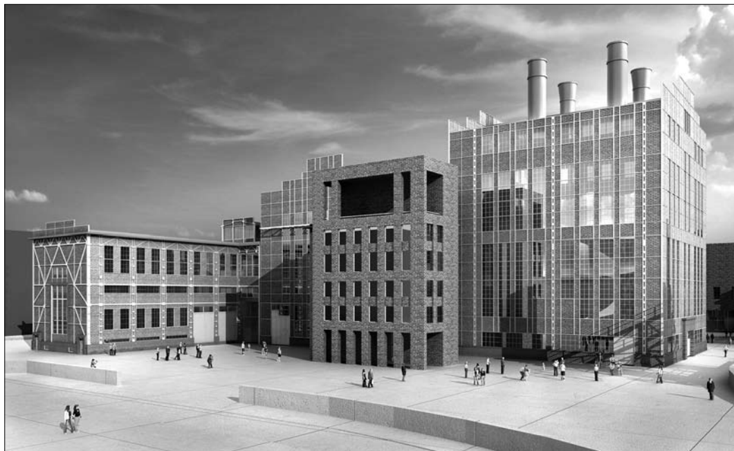
Wizualizacja EC1-Zachód (zespół projektowy Biura Realizacji Inwestycji „Fronton” sp. z o.o., zespół projektowy pracowni Mirosław Wiśniewski – Urbanistyka i Architektura sp. z o.o.)

W EC1-Zachód od strony południowej dostawiono budynek, który połączy elektrownię z ul. Tuwima. Powstały m.in. dodatkowa powierzchnia wystawiennicza i zaplecze gastronomiczne. Obiekt jest w stanie surowym, lada moment zaczną się prace wewnątrz. Na dachu zostanie posadzona trawa.