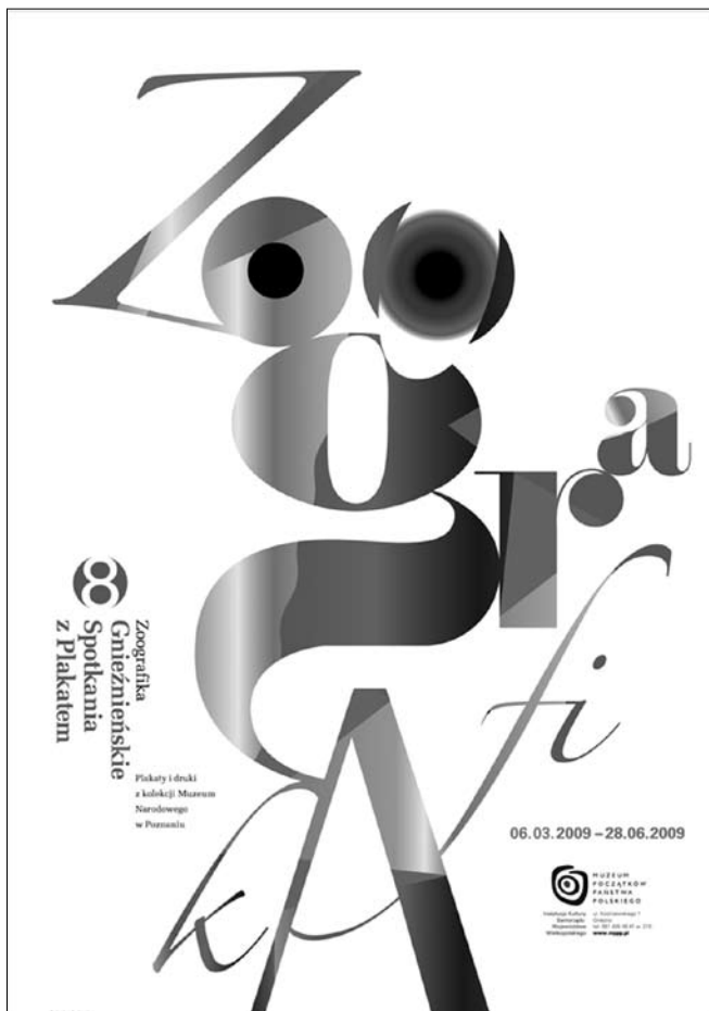
Plakat Sławomira Iwańskiego