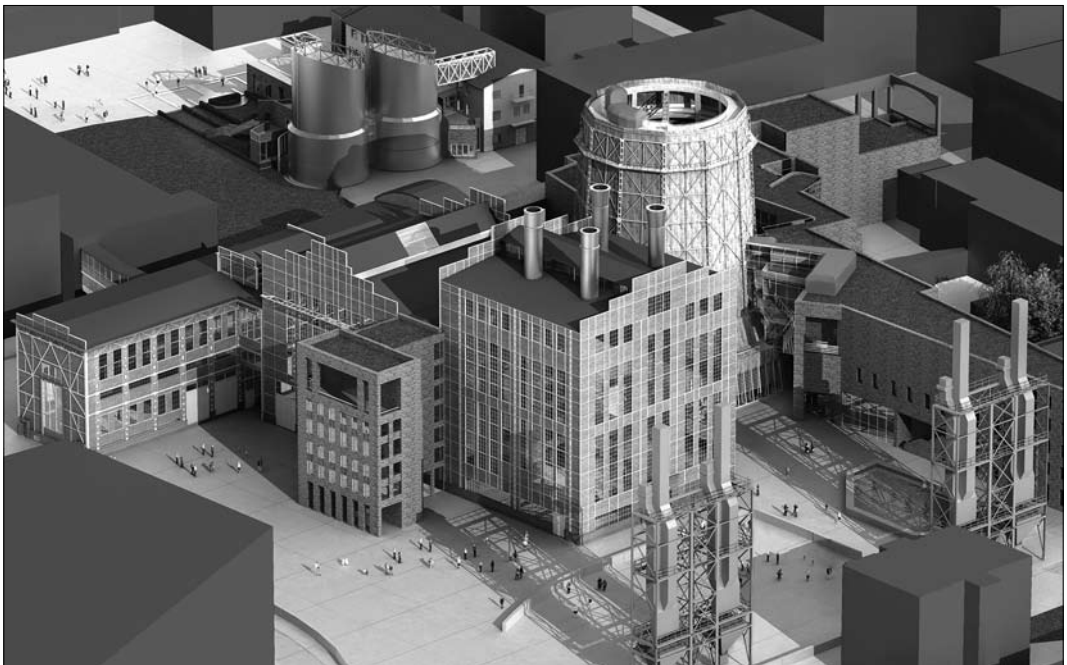
Wizualizacja EC1-Zachód (zespół projektowy Biura Realizacji Inwestycji „Fronton” sp. z o.o., zespół projektowy pracowni Mirosław Wiśniewski – Urbanistyka i Architektura sp. z o.o.)

– W Polsce wzorcem jest warszawskie Centrum Nauki „Kopernik”, ale tam program jest realizowany w zupełnie innej logice – jest pełna interaktywność, są otwarte przestrzenie i nie ma kolejności zwiedzania. Tutaj można będzie zaprogramować własny kierunek zwiedzania, ale musi być pewien reżim, bo jesteśmy w obiekcie poprzemysłowym. Druga i trzecia ścieżka będą bardziej zbliżone do formuły prezentacji w „Koperniku”, ale także z ograniczeniami.