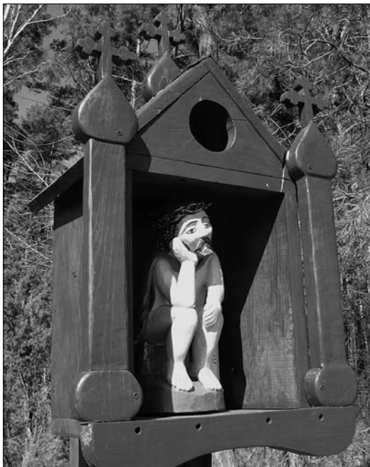
Pejzaż Wszystkich Świętych – Chrystus Frasobliwy w Zdunach (czytaj str. 40-41)