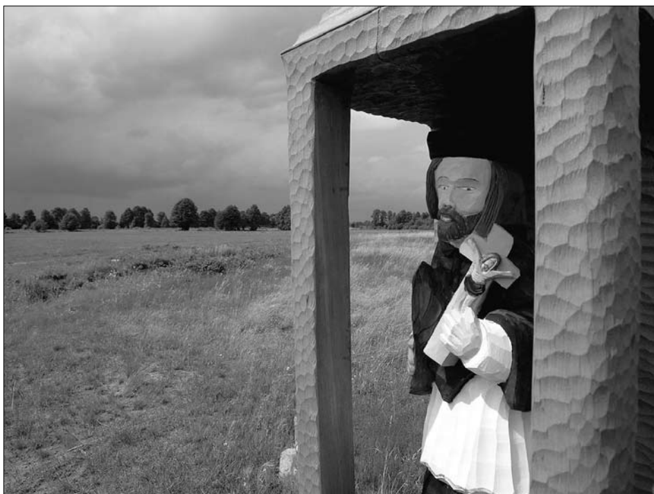
Pejzaż Wszystkich Świętych – św. Jan Nepomucen w Grobli (czytaj str. 40-41)