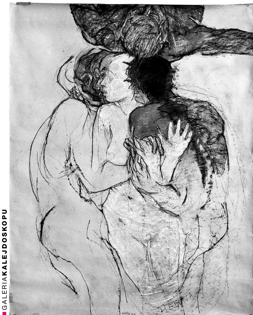
■ GALERIA KALEJDOSKOPU

Autor jest profesorem Akademii Sztuk Pięknych w Krakowie, a w latach 1979-2004 wykładał w ASP w Poznaniu. Charakterystyczne dla jego twórczości jest m.in. odwoływanie się do dzieł innych autorów. Wystawa przygotowana została przez Miejską Galerię Sztuki w Łodzi wspólnie z Miejską Galerią Sztuki w Częstochowie.