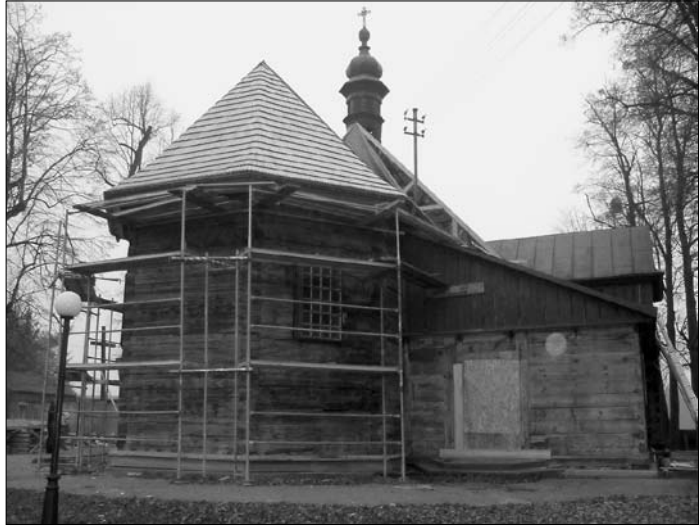
Kościół pw. Wszystkich Świętych w Kołacinku