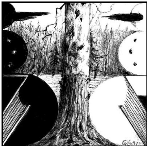
rys. Ryszard Kuba GRZYBOWSKI