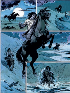
Czarna galera, Thorgal