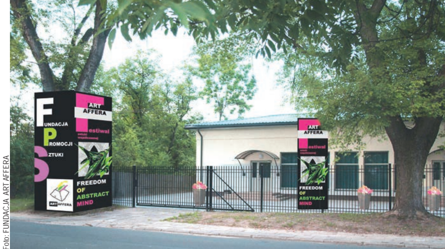
Wizualizacja festiwalu sztuki „wyabstrahowanej”