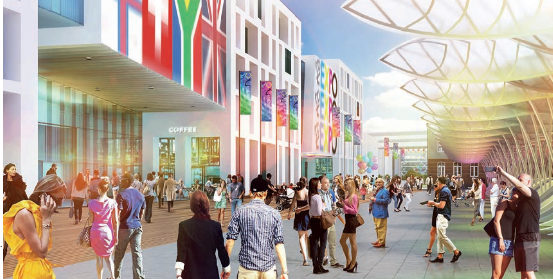
Wizualizacja pawilonów wystawowych dla Expo w Łodzi

ło podzielone na osiem obszarów. Głównie w centrum Łodzi. Rewitalizacja rozumiana jako proces przemian społecznych, przestrzennych i ekonomicznych ma poprawić sytuację „kryzysowego” terenu. Według encyklopedycznej definicji celem rewitalizacji jest przywrócenie do życia zdegradowanej części miasta i uzupełnienie jej o nowe funkcje. Zdaniem władz Łodzi ma się tam po prostu lepiej żyć i pracować.