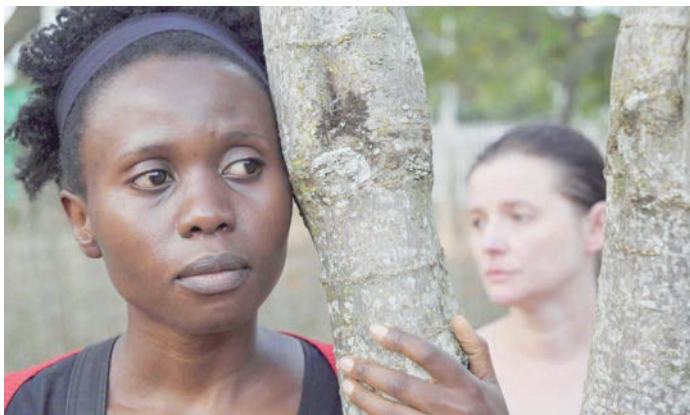
Kadr z filmu „Ptaki śpiewają w Kigali”

W tę atmosferę wpisał się też niezwykle dokument Vita Klusaka „Biały świat według Daliborka”, będący portretem czeskiego neonazisty. Przeraza nie to, że Daliborek dekoruje pokój swastykami i śpiewa nacjonalistyczne piosenki, ale to, że Czesi akceptują takie zachowania. Zło bierze się z obojętności. *