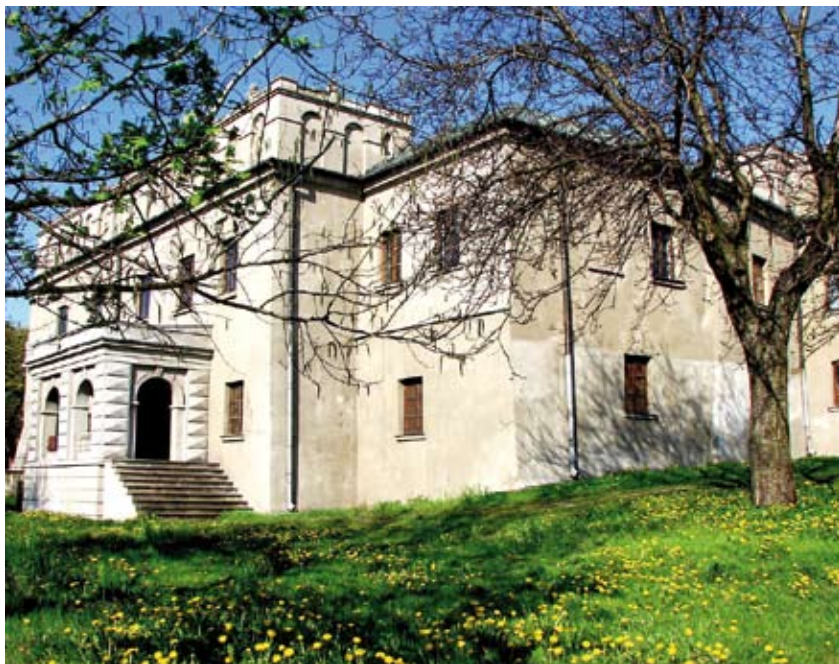
Muzeum Regionalne w Opocznie

opoczyńskiej” sięga po znaleziska archeologiczne z epoki brązu – kultury łużyckiej. Do najstarszych i najciekawszych obiektów z działu historii należą m.in. skrzynia cechu ślusarsko-kowalskiego z XVII w., rycina ukazująca bitwę pod Żarnowem w czasie potopu szwedzkiego z 1655 roku. Na wy-