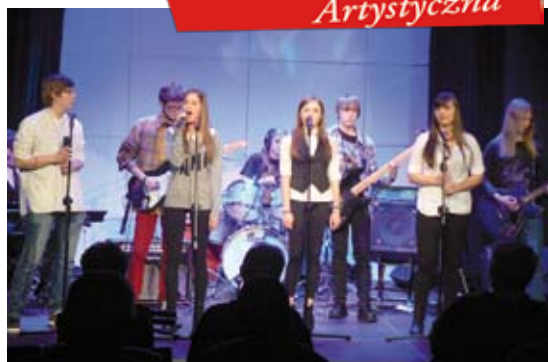
ROSA – Tadeusza Nic Nie Rusza