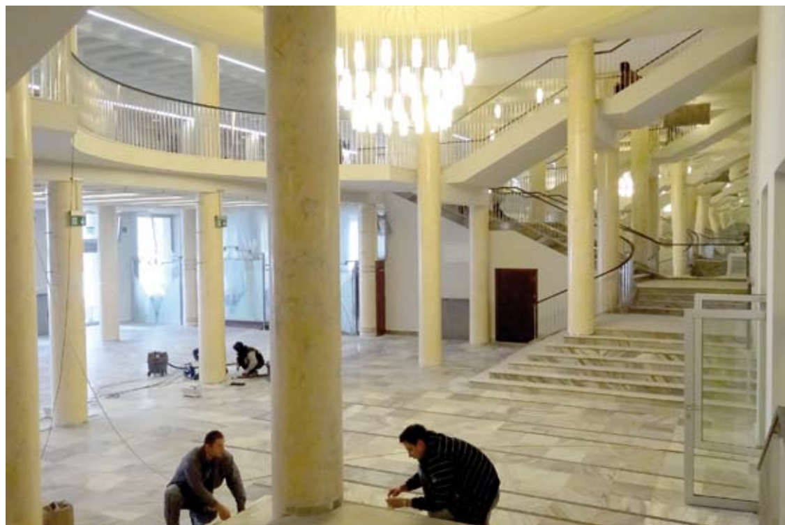
Hol opery tuż przed otwarciem