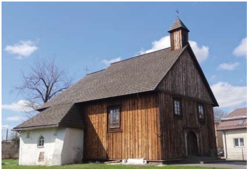
Kościół św. Anny w Brzezinach

Dla gości, którzy postanowili zostać w Łowiczu dzień dłużej, organizatorzy przygotowali wycieczki z przewodnikiem. Można było wybrać jedną z trzech tras: do skansenu w Maurzycach, do Arkadii i Nieborowa albo do Muzeum Ludowego Rodziny Brzozowskich w Sromowie. Obowiązkowym punktem wszystkich wędrowek było oczywiście zwiedzanie Łowicza i wizyta w Muzeum Diecezjalnym ulokowanym w wieży południowej Bazyliki Katedralnej. *