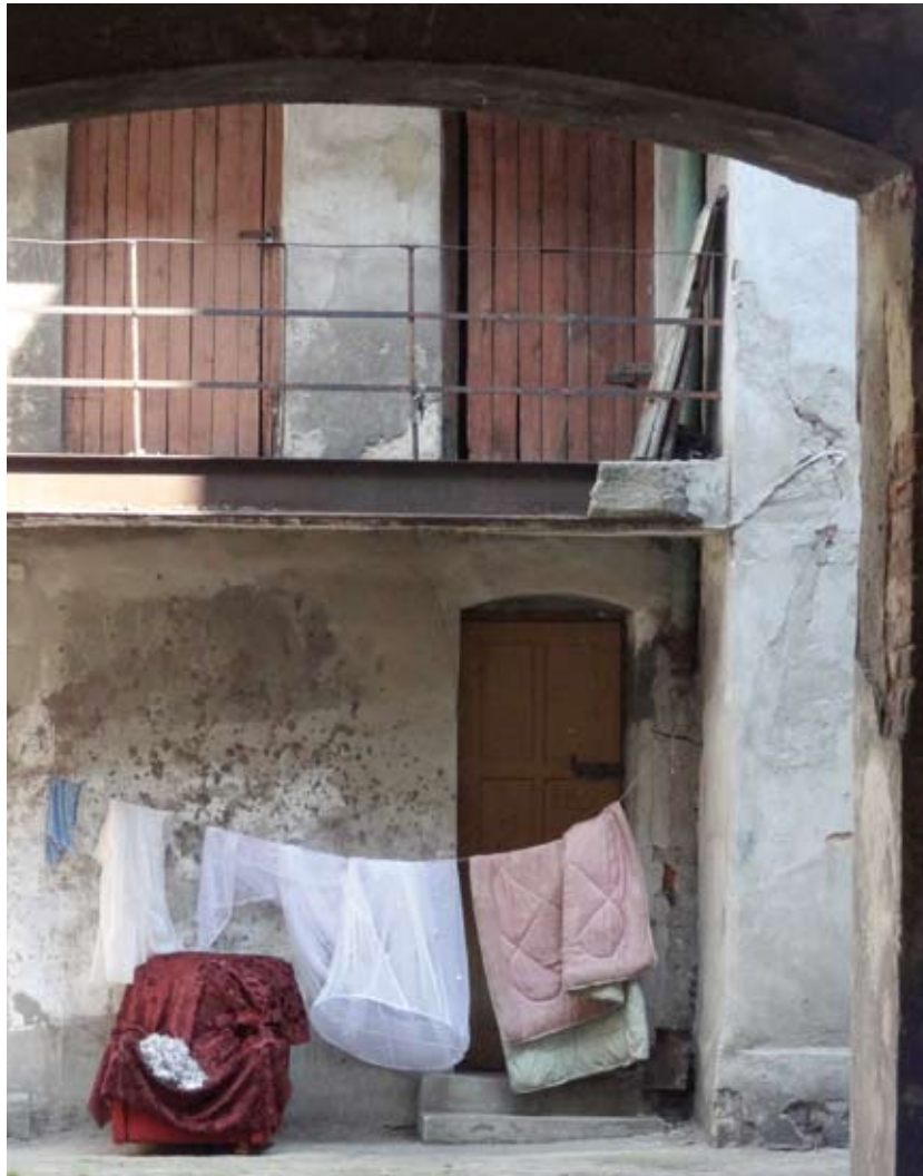
Jedno z łódzkich podwórek

dzi”. Zakłada on artystyczne przetworzenie jednego z podwórek. Jak? Zbigniew Brzoza nie chce tego zdradzić. – Powstanie miejsce, które stanie się tak niezwykle, jak sztuczna palma tej autorki w Warszawie. Nie na czas jednego festiwalu, ale na stulecia.