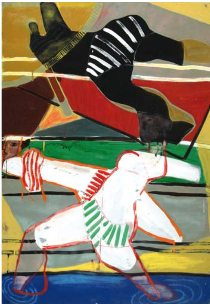
Na molo, lata 50.

Przyglądał się rzeczywistości i do niej odwoływał, a niekiedy – tworząc kolaże, a potem abstrakcyjne kompozycje – dosłownie brał z niej to, co wydało mu się przydatne do stworze-