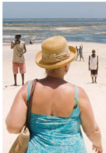
Kadr z filmu „Raj: Miłość”