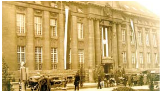
Budynek banku w 1937 r.

Warto zatrzymać się tu na chwilę i popatrzeć na ciekawą architekturę oraz mnogość symbolicznych i alegorycznych ozdób. Potężna fasada wyraża powagę i moc banku, podkreśla ją także wielki portyk złożony z wysokich kolumn. Koń w kartuszu zachęca do wyteźonej pracy, a rogi obfitości wskazują na efekty pracy, głowa Hermesa, patrona handlu, nawiązuje do pierwotnej nazwy banku i finansowych operacji. Pomiedzy oknami umieszczono kilka płaskorzeźb o podobnej wymowie: syrenę z rogiem ob-