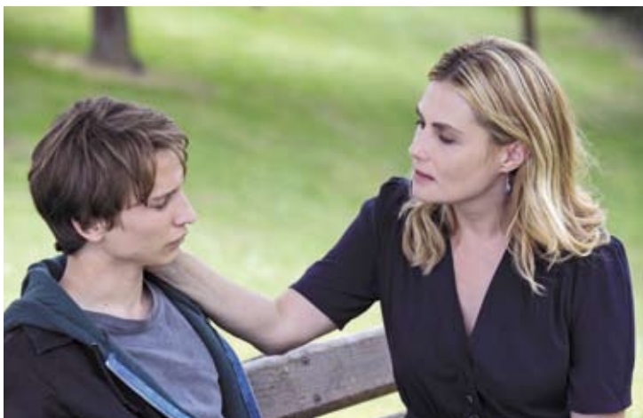
„U niej w domu”

„ Hipnotyzer ”, kryminał, Szwecja, reż. Lasse Hallström, obsada: Tobias Zilliacus, Mikael Persbrandt, Lena Olin. Bohaterem filmu jest detektyw Joona Linna, badający sprawę potrójnego morderstwa. Jedyne ocalały – chłopiec – jest zbyt przerażony, by zeznać.