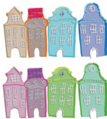
Projekt scenografii do spektaklu

Teatr Arlekin zaplanował 19 V premierę spektaklu pt. „ Szary Chłopiec ” (do budynku UŁ, ul. Piłsudskiego 3). To opowieść o tolerancji i akceptacji, a także o tajemniczym tworzeniu. Jak mogło wyglądać stworzenie świata? Może jak dziecięca zabawa z wykorzystaniem papieru i farb? Razem ze znużonym Szarym Chłopcem mali widzowie dowiedzą się, że kolory i emocje mają ze sobą wiele wspólnego... Przedstawienie jest dedykowane dzieciom w wieku 2,5-5 lat.