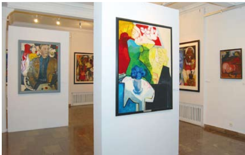
Wystawa w Muzeum Miasta Łodzi